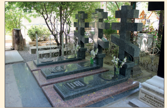
Место захоронения митрополита Арсения на Боткинском кладбище г. Ташкента

Находясь в ссылке в Ташкенте, Владыка был духовным наставником архиепископа Луки (Войно-Ясенецкого) и умер на его руках в ташкентской больнице. Похоронен на Боткинском кладбище Ташкента.