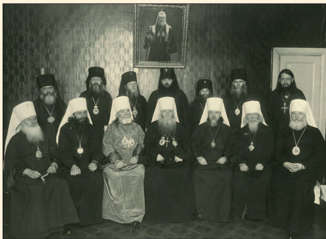
Митрополит Арсений (в светлой рясе) на заседании Временного Патриаршего Священного Синода

Вместе с этим он являлся редактором «Кишинёвских епархиальных ведомостей», где опубликовал около ста статей и заметок, преимущественно церковно-исторического содержания. Эти публикации способствовали формированию церковного самосознания духовенства и мирян, укрепляли интерес к истории Православной Церкви в крае и служили важным просветительским инструментом своего времени.