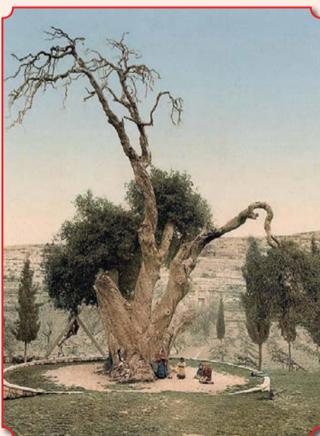
Мамврийский дуб на фото 1890–1900 годов

сорок веков назад, оказал гостеприимство трем ангелам, предвозвестившим рождение от него сына. Раньше на этом месте находился храм византийской эпохи, построенный святой царицей Еленой. 22 мая 1871 года у дуба Мамврийского была отслужена первая православная Литургия. В 1874 году стараниями отца Антонина