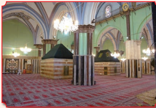
Мусульманская часть комплекса Махпела (т. н. «Зал Исаака») и каменные комнаты

гих – что перестанет сходить Благодатный огонь и Афон покинет Иверская икона Божией Матери). Примерно в 1997 году от корня дерева начал расти новый молодой побег, что дало верующим основание считать, что мир в очередной раз помилован. За двадцать лет побег этот превратился в кустистое зелёное молодое деревце. В феврале 2019 года весь православный (и не только) мир потрясло