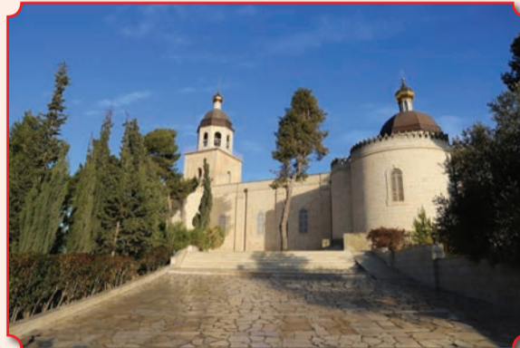
Подворье Русской Духовной Миссии в честь святых Праотцев (монастырь Святой Троицы), г. Хеврон