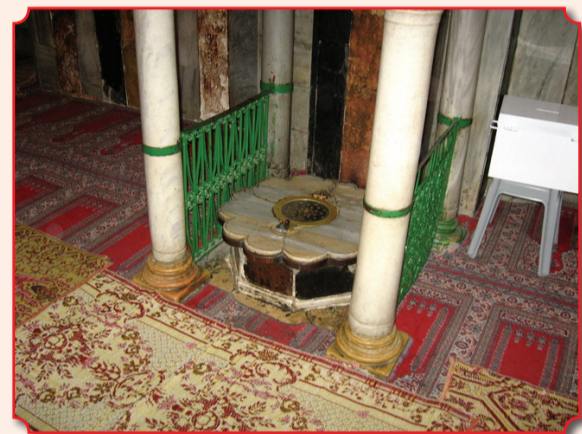
Так называемое «Светильничное отверстие» в мусульманской части комплекса Махпела

В полу мечети имеются два отверстия, ведущие в пещеру, одно закрыто каменными плитами, другое («светильничное») – открыто; сюда, по мусульманскому обычаю, опускается неугасимая лампада. «Светильничное отверстие» является верхней частью узкой вертикальной шахты. Шахта ведет в подземную, довольно просторную, так называемую «Светильничную комнату» – помещение иродианских времен. Из комнаты идет горизонтальный коридор длиной 16 м – также иродианское сооружение – к идущей вверх лестнице. Лестница находится рядом с заложением еще крестоносцами основным входом в восточной стене комплекса. Над лестницей имеется еще один ход наверх, в зал Исаака, также заложённый. Таким образом, светильничное отверстие в настоящее время – единственный способ попасть в нижнюю часть комплекса. Из светильничной комнаты имеется узкий проход вниз, за которым находятся две подземные пещеры.