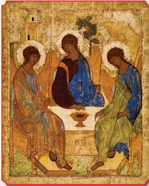
Один из самых выдающихся шедевров православной иконографии – рублёвская «Троица»

Безусловно, одним из символов Дня Святой Троицы является икона, написанная древнерусским мастером Андреем Рублёвым в XV веке. В основу иконы положен ветхозаветный сюжет «Гостеприимство Авраама», изложенный в XVIII главе библейской книги Бытия. Он повествует о том, как праотец Авраам, родоначальник богоизбранного народа, встретил у дубравы Мамре троих таинственных странников (в следующей главе они были названы ангелами). Во время трапезы в доме Авраама ему было дано обетование о грядущем чудесном рождении сына Исаака. По воле Бога от Авраама должен был произойти «народ великий и сильный», в котором «благословятся... все народы земли». В разные эпохи этот сюжет получал различные толкования, однако уже к IX–X векам преобладающей стала точка зрения, согласно которой явление Аврааму троих ангелов символически раскрыло образ единосущного и триипостасного Бога – Святой Троицы.