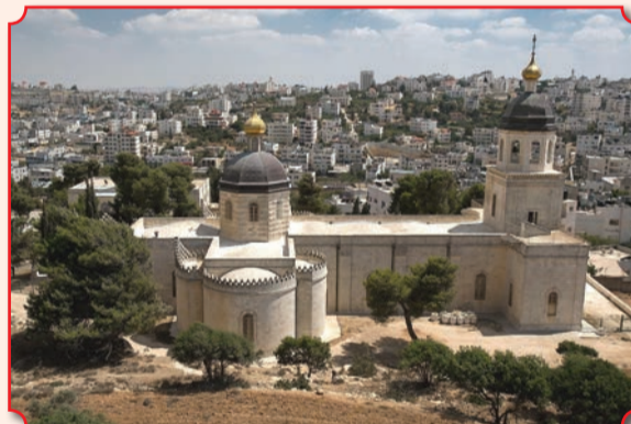
Монастырь Святой Троицы на фоне Хеврона

Долгое время Подворье находилось в ведении Русской Зарубежной Церкви. 5 июля 1997 года участок с дубом Мамврийским был возвращен Московскому Патриархату. На самом возвышенном месте участка высятся смотровая башня, служившая населенникам наблюдательным пунктом для определения места положения каравана с паломниками, шествующими в Хеврон. И по сей день паломники во множестве приезжают сюда, чтобы прикоснуться к древней библейской истории и поклониться Мамврийскому дубу, свидетелю аврамова гостеприимства, как символу деятельной любви к Богу и ближнему. На праздник Святой Троицы ключарь подворья совершает Литургию у самого дуба. На третий же день праздника Троицы в сопровождении большого числа паломников начальник и клирики Миссии, игуменнии и сестры иерусалимских монастырей, члены дипломатических миссий православных стран приезжают в Хеврон, чтобы совершить Божественную Литургию на месте явления Пресвятой Троицы.