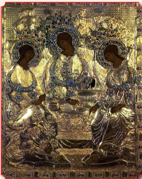
«Троица» до 1904 года: в окладе Бориса Годунова с цатами Михаила Фёдоровича и ризами XVIII века (золото, серебро, драгоценные камни, жемчуг; чеканка, гравировка, чернь, эмаль, золочение)

казался от традиционных повествовательных деталей, которые обычно включались в изображения «Гостеприимства Авраама». Нет Авраама, Сарры, сцены заклания тельца, атрибуты трапезы сведены к минимуму: ангелы представлены не вкушающими, а беседующими. Жесты ангелов, плавные и сдержанные, свидетельствуют о возвышенном характере их беседы. За средним ангелом изображено дерево, которое переосмысливается не только как дуб Мамврийский, но и как «дерево жизни», «дерево вечности», которое могло быть символом воскресения. За левым ангелом возвышаются стройные палаты, что является образом домостроительства Божиего. За правым ангелом возвышается гора – древний символ всего возвышенного (в Библии «гора» есть образ «восхищения духа», потому на ней и происходят самые значительные события: на Синае Моисей получает скрижали Завета, Преображение Господне совершается на Фаворе, Вознесение – на горе Елеонской). Единство трёх ипостасей Святой Троицы является совершенным прообразом всякого единения и любви: «Да будут все еди-