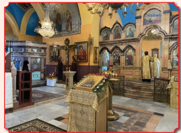
Интерьер храма в честь святых Праотцев на Подворье Русской Духовной Миссии в Хевроне

здесь был построен каменный двухэтажный дом для паломников. В 1884 году два Патриарха – Иерусалимский Никодим и Константинопольский Иоаким III – посетили русский участок в Хевроне и «благословили на сем месте быть храму Божию». По причине сложной ситуации в городе, где проживали в основном мусульмане, вопрос о постройке храма был поднят лишь в 1904 году начальником Русской Духовной Миссии архимандритом Леонидом (Сенцовым). С 1906 по 1914 годы проходил тяжелый процесс получения турецкого фирмана на строительство и освящение храма. В 1914 году здесь построен храм святых Праотцев – последний русский храм в Святой Земле, возведенный до революции. В начале 1920-х годов, после того как связь с Русской Церковью в Отечестве прервалась, данный участок со всеми постройками (вместе с Русской Духовной Миссией) перешёл в ведение Русской Зарубежной Церкви. 31 мая 1925 года Патриархом Иерусалимским Дамианом монастырский храм был освящён во имя святых Праотцев, южный придел во имя Пресвятой Троицы и северный придел во имя святителя Николая. Недалеко от храма выстроен был двухэтажный дом для паломников.