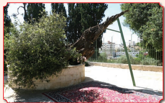
Мамврийский дуб в наши дни – фото сделано во второй день Пятидесятницы 2020 года

Существует православное предание, что смерть этого дерева является одним из трёх признаков конца света (два дру-