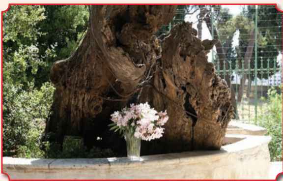
Мамврийский дуб в наши дни – фото сделано во второй день Пятидесятницы 2020 года