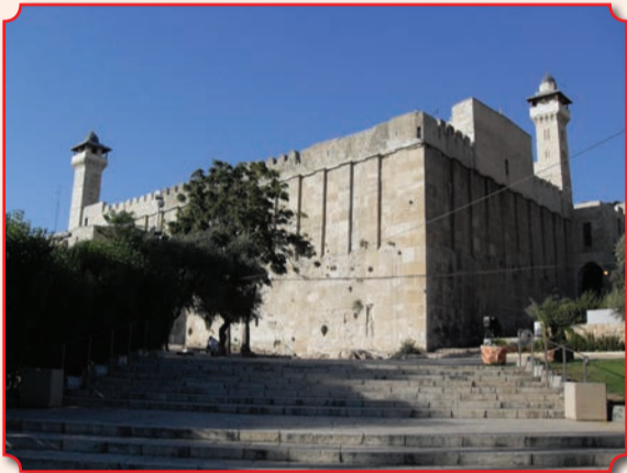
Пещера Патриархов (также пещера Махпела от ивр. Ме'арат а-махпэла – букв. «Двойная пещера»)

Ещё одна святыня Хеврона – Пещера Патриархов, склеп в древней части города, в котором, согласно книге Бытия (Быт. 23; 49:29–32; 50:13), похоронены еврейские праотцы Авраам, Исаак и Иаков, а также их жёны Сарра, Ревекка и Лия. Авраам купил это место у хетта Эфрона за 400 шекелей серебра. Согласно еврейской традиции, здесь также покоятся тела Адама и Евы. Иудеями пещера почитается как второе по святости после Храмовой горы место, также почитается христианами и мусульманами. Мемориальное здание на поле Махпела было сооружено при Ироде Великом. В византийскую эпоху южная оконечность здания с гробницами Исаака