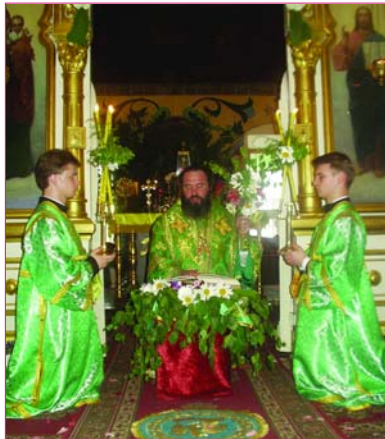
Жизни и Сокровища всех благ Святого Духа.

В этом году, когда Приднестровская Молдавская Республика празднует 15-летие своего образования, День Святой Троицы совпал со скорбной датой в истории нашего государства - 19 июня 1992 года началась страшная братоубийственная война, жертвами которой стали многие наши сограждане.