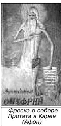
Фреска в соборе Протата в Карее (Афон)

Когда отроку исполнилось 7 лет, с ним произошло чудо. Ключарь монастыря каждый день давал ему часть хлеба. Мальчик, посещая храм, подходил к иконе Богородицы с Богомладенцем и обращался к Иисусу со словами: "Ты такой же Младенец, как и я, но Тебе ключарь не дает хлеба, поэтому возьми мой хлеб и ешь". Младенец Иисус протягивал Свои ру-