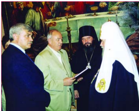
Епископ Тираспольский и Дубоссарский Юстиниан и Председатель ВС ПМР Г.С. Маракуца поздравляют Святейшего Патриарха. Слева - Г.С. Полтавченко, полномочный представитель Президента РФ в Центральном Федеральном округе.

10 ИЮНЯ - 15-летие интронизации Святейшего Патриарха Московского и всея Руси Алексия II. Поздравляли Первосвященителя со знаменательным юбилеем в эти июньские дни множество высокопоставленных лиц и простых людей - чад Русской Православной Церкви. От имени своей Приднестровской паствы приветствовать Предстоятеля прибыл Епископ Тираспольский и Дубоссарский Юстиниан. На торжествах, посвященных юбилею патриаршей интронизации, Председатель Верховного Совета Приднестровской Молдавской Республики Григорий Степанович Маракуца поздравил Святейшего от лица народа Приднестровья и поблагодарил его "за молитвы, попечительство об укреплении гражданского мира, о гармонизации межнациональных и межрелигиозных отношений".