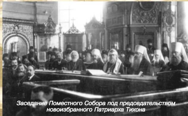
Заседание Поместного Собора под председательством новоизбранного Патриарха Тихона

Но в том же году, когда началась новая российская смута, Русская Православная Церковь, в результате вынужденного отречения царя-мученика Николая II лишившаяся защиты и опеки со стороны государственной власти, которая уже при Временном правительстве встала на путь