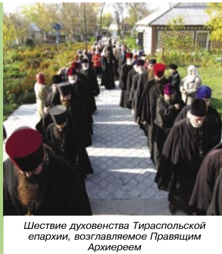
Шествие духовенства Тираспольской епархии, возглавляемое Правящим Архиереем

Собрание началось с общего молебна во Всехсвятском соборе г. Дубоссары, где