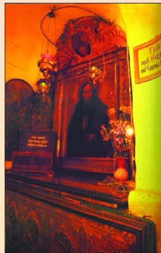
Место погребения прп. Феодосия