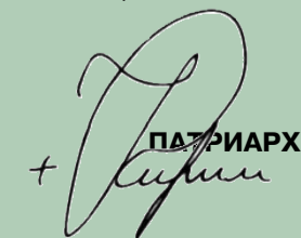
ПАТРИАРХ МОСКОВСКИЙ И ВСЕЯ РУСИ Рожество Христово, 2012/2013, град Москва

Сердечно поздравляя вас с нынешним торжеством, молитвенно испрашиваю всем нам у Богомладенца Христа духовных и телесных сил, дабы каждый из нас мог личным примером свидетельствовать миру, что родившийся ныне Господь наш и Бог есть Любовь (см. 1 Ин. 4, 8). Аминь.