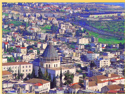
Назарет. Храм на месте дома, где жило Святое Семейство.

Спеленав его, Дева Мария собственными руками положила Младенца Иисуса в ясли, первая среди людей начав, таким образом, свое служение Ему.