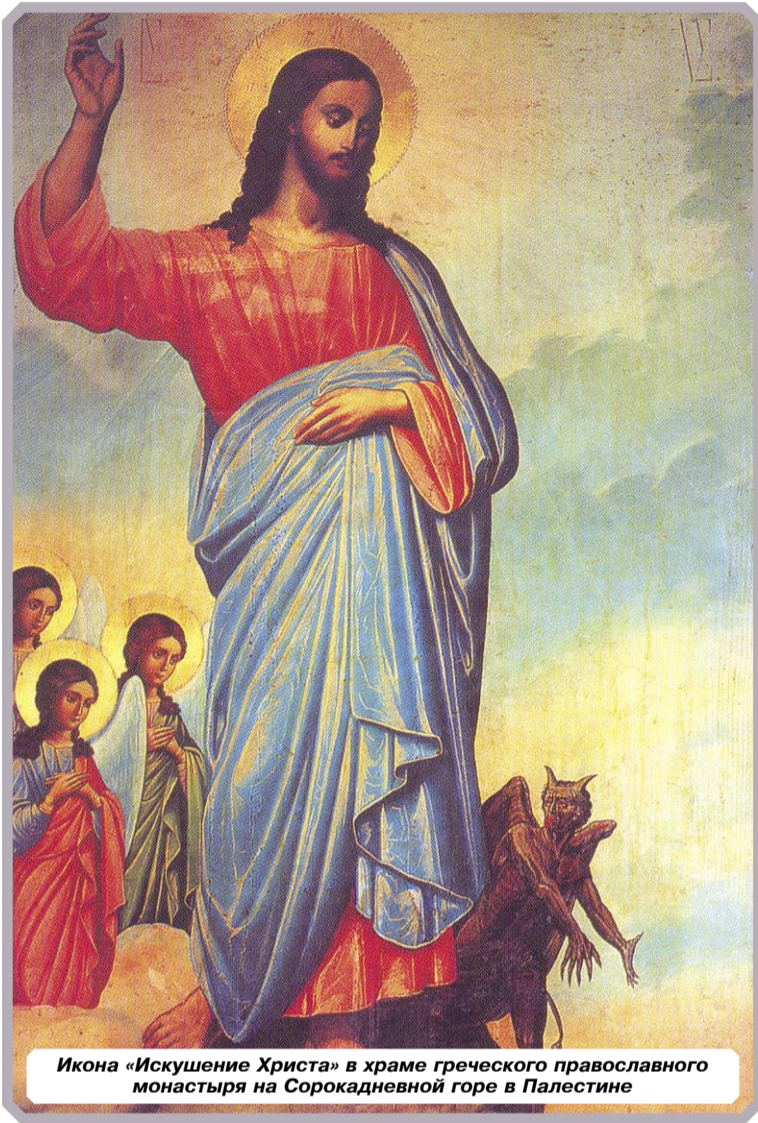
Икона «Искушение Христа» в храме греческого православного монастыря на Сорокадневной горе в Палестине

Иисус возведен был Духом в пустыню, для искушения от диавола, и, постившись сорок дней и сорок ночей... Опять берет Его диавол на весьма высокую гору и показывает Ему все царства мира и славу их, и говорит Ему: всё это дам Тебе, если, пав, поклонись мне. Тогда Иисус говорит ему: отойди от Меня, сатана, ибо написано: Господу Богу твоему поклоняйся и Ему одному служи. Тогда оставляет Его диавол, и се, Ангелы приступили и служили Ему.