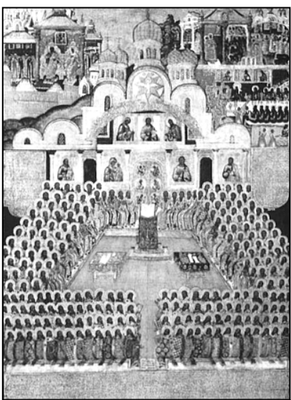
Икона святых Отцов VII Вселенского Собора

Анафема провозглашается соборно не только иконоборцам, но всем, кто совершил тяжкие прегрешения перед Церковью. В России чин Православия был введен в XIV в. и состоял из греческого синодика этого чина. В конце XVIII в. чин Православия был исправлен и дополнен митрополитом Новгородским и С.-Петербургским Гавриилом. Чин Православия совершался в кафедральных соборах после прочтения часов или перед окон-