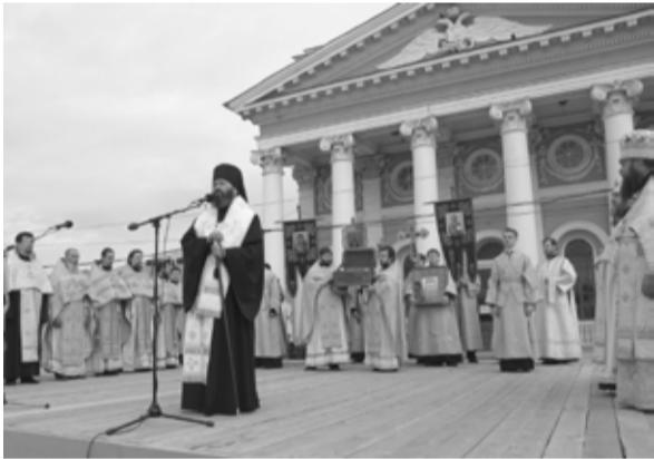
Епископ совершает молебен перед мощами преподобного Иакова на центральной площади Костромы