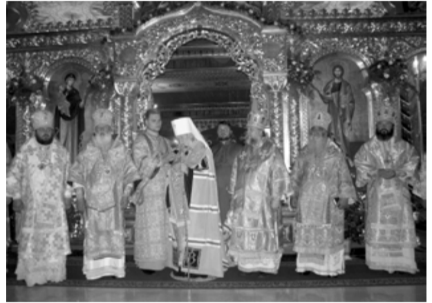
Архипастыри, принявшие участие в торжествах во главе с митрополитом Киевским и всея Украины Владимиром

По окончании Литургии состоялась крестный ход и перенесение мощей святителя Иннокентия из Свято-Успенского кафедрального собора в Спасо-Преображенский кафедральный собор.