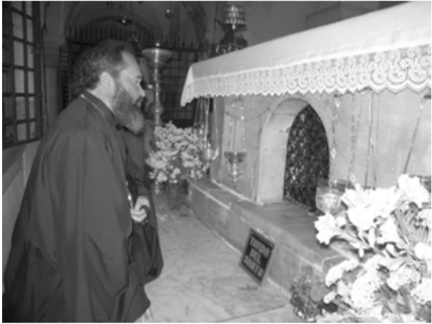
Молитвенное поклонение мощам святителя Николая