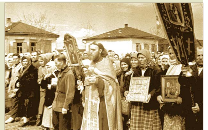
Молитвы о спасении Отечества. 1942 год, Белоруссия.