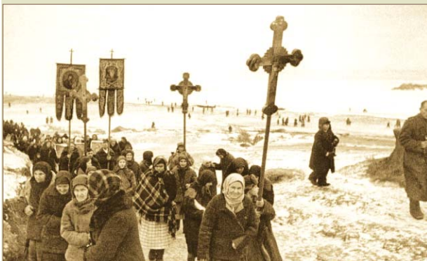
Водосвятный молебен на Днепре и крестный ход верующих села Лоцкаменка на Украине. 1943 год.

А теперь надо сказать о цене Победы. Как её измерить? Цифрами? Но статистика никого не впечатляет, ибо показывает, чем заплатило за победу государство, а государство есть абстракция. Советский Союз потерял в войне более 20 млн своих граждан. На его оккупированных территориях были разрушены тысяча крупных предприятий и десять тысяч километров железных дорог. Большие потери? Очень большие. Но нам важно понять, чем заплатил за победу русский человек, какие потери понесла живая конкретная личность. Вопрос не в том, сколько стоит отданная за победу жизнь, а в том, чем они будут вознаграждены за отданную жизнь. Подумаем сейчас о тех, кто остался в живых. Да, они