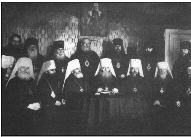
Митрополит Сергей (Страгородский) и Священный Синод Русской Православной Церкви, 1927 год

и священнослужителей - архипастырей и священников. Именно они были призваны утешать и духовно окормлять людей, лишенных родины. Возглавил русское духовенство в эмиграции выдающийся иерарх Русской Православной Церкви митрополит Антоний (Храповицкий), бывший одним из трех кандидатов на престол московских первосвященителей.