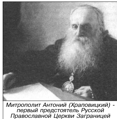
Митрополит Антоний (Храповицкий) - первый предстоятель Русской Православной Церкви Заграницей

Конфликт между Московским и Румынским Патриархатами возник в 1992 году, когда Священный Синод в Бухаресте учредил на территории Молдавии автономную Бессарабскую митрополию по ходатайству группы молдавских священнослужителей и политиков от Христианско-демократической народной партии, выступающей за объединение Молдавии с Румынией. Решение основывалось на том, что в результате оккупации румынскими войсками в 1918 году Бессарабия (территория между Днестром и Прутом) с 1918-го по 1940 год входила в состав Румынского королевства, а ее приходы находились в юрисдикции Румынского Патриарха. По вердикту Европейского суда по правам человека и специальной рекомендации Парламентской ассамблеи Совета Европы правительство Молдовы вынуждено было зарегистрировать эту церковную структуру, канонически подчиняющуюся Румынской Патриархии, невзирая на протест Молдавской митрополии.